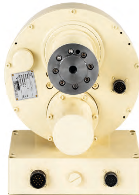
Bottom view of R&S®RD016