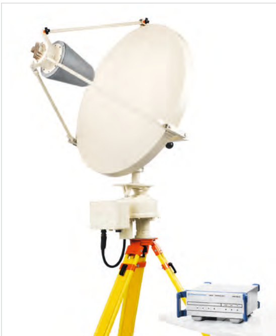
R&S®RD016 with R&S®AC008 and R&S®GB016