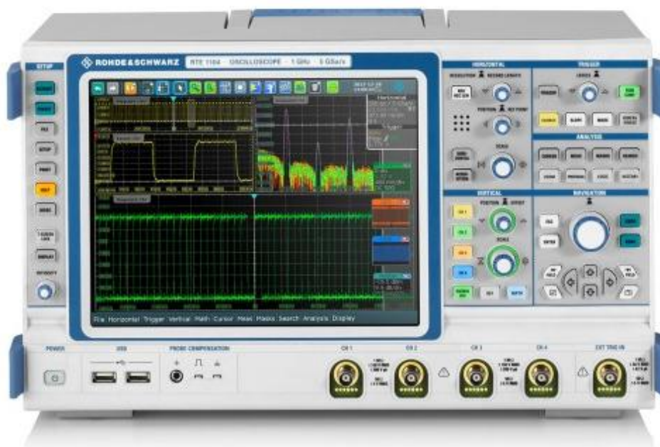
Рисунок 1. Фотография общего вида осциллографов цифровых запоминающих RTE1022, RTE1024, RTE1032, RTE1034, RTE1052, RTE1054, RTE1102, RTE1104

Схема пломбировки от несанкционированного доступа и обозначение мест для размещения наклеек приведены на рисунке 2.